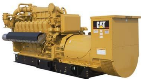
Генераторная установка показана с оборудованием, устанавливаемым по специальному заказу