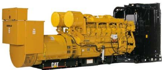
Генераторная установка показана с оборудованием, устанавливаемым по специальному заказу